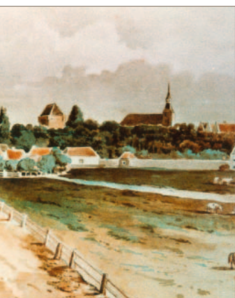
De zes tuinhuisjes van het restauratieproject zijn in een tekening, naar een aquarel van Jacob van Deventer uit omstreeks 1560, aangegeven. De natte buitengracht werd rond 1626 in zijn geheel gedempt. In 1696 ging men over tot verkoop van delen van deze buitenwallen aan burgers.

Hattemse tuincultuur De zes gerestaureerde tuinhuisjes zijn in de achttiende en negentiende eeuw op de ondergrond van de gedempte buitengracht gebouwd, een overblijfsel uit de eerste ontwikkeling tot vestingstad. Hattem kende in die periode namelijk een rijke tuincultuur rondom de stad. Tijdens de eerste kadastrale opmeting in 1832 werden er ruim 35 tuinhuisjes geregistreerd. Vanwege de bijzondere ligging aan de binnengracht