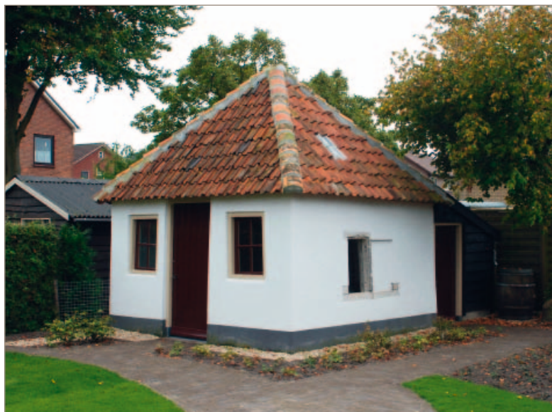
Het ontleisterde tuinhuisje Grote Gracht 13 zat vol met bouwsporen. De oorspronkelijke vensters met luiken zaten op zithoogte en waren opgebouwd uit hergebruikte zandstenen onderdelen afkomstig van kruisvensters. De middenmontant werd tijdens de restauratie als dorpel onder de ingang teruggevoerd en is weer teruggeplaatst in het halve venster. De houten vensters naast de ingang zijn pas later ingebroken.

buitenleven. Altijd vond men in die tuinen een koepel; hierin werden de gewone benodigheden geborgen; hij gaf ook beschutting bij onverwacht slecht weer. Zulke koepels werden dan ook in menigte aangetroffen in de nabijheid der steden, goed zichtbaar, daar zij steeds dicht bij den grooten weg stonden. In de 19de eeuw kwamen de theetuinen geheel in onbruik; de uitbreiding der steden, de stijging van de waarde van den nabij de stad gelegen grond waren hen noodlottig. De niet altijd mooie, maar typische koepeltjes zijn vrijwel verdwenen; nauwelijks treft men er nog enkele aan in de nabijheid der provinciesteden'.