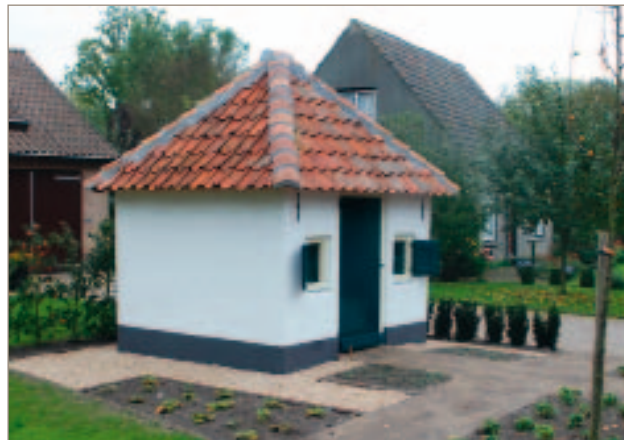
Het oorspronkelijke tuinperceel, waarop nu ook het tuinhuisje Stadslaan 2 staat, is na 1832 in twee gedeeltes opgesplitst. Op het onbebouwde gedeelte werd dit kleine tuinhuisje gebouwd. Rond 1955 is het oorspronkelijke tuinhuis op het buurperceel, en toen als woning in gebruik, in de contouren van het nieuwe woonhuis ingebouwd..