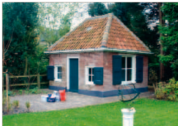
Het tuinhuis Grote Gracht 35, met een vloeroppervlakte van ruim 15m 2 , is na 1832 ontstaan ter vervanging van een kleiner exemplaar. De grachtgerichte gevel is hier voor het eerst beduidend breder dan dat het tuinhuisje diep is. Door deze nieuwe opzet was zo voldoende ruimte voor een toegang met flankerende vensters. In het begin van de 20ste eeuw is in de westgevel nog een groot venster ingebroken. Achter dit tuinhuis is de oorspronkelijke sloot nog grotendeels aanwezig.

werden de grote percelen in de twintigste eeuw gaandeweg huispercelen. Mede door de plaatst van het tuinhuis, meestal achter op het perceel, bleven gelukkigerwijs enkele van deze bijzondere bouwwerkjes voor Hattem behouden.