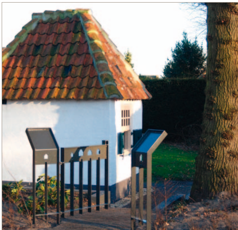
Het kleinste tuinhuisje van het project heeft maar een vloeroppervlakte van 3,5 m 2 en staat op het perceel Stadsaan 1. Het hekje aan het trottoir kreeg tijdens de feestelijke afsluiting op 9 april informatiepanelen over het tuinhuisjesproject.

De eerste kadastrale opmeting als basis Bij het integrale bouwhistorisch onderzoek kon gebruik worden gemaakt van de opmetingen, het veldwerk, oude afbeeldingen en het kadastrale minuut van Hattem uit 1832. Deze laatste bron bleek zeer behulpzaam bij het determineren van de tuinhuisjes. In het bijbehorende register, 'de Oorspronkelijke Aanwijzende Tafel' geheten, zijn de groottes van de bouwwerkjes vermeld. Het was echter volkomen onduidelijk hoe de opgave van deze groottes destijds tot stand zijn gekomen. Er zijn namelijk grote verschillen t.a.v. de opgemeten bebouwde oppervlaktes en de groottes vermeld in het register. Soms waren deze groter en soms juist kleiner. Voor het ontstaan van deze verschillen konden twee redenen worden aangevoerd; het bouwwerkje was na die eerste momentopname sterk gewijzigd of de opgegeven grootte was een optelling, dus meer dan de bebouwde oppervlakte alleen.